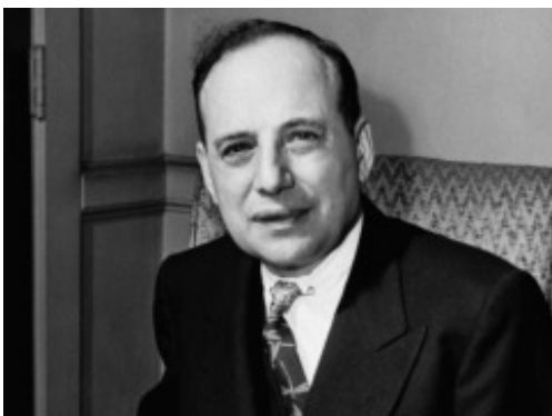
เบนจามิน เกรแฮม (Benjamin Graham)

รายงานฉบับนี้จัดทำขึ้นโดยข้อมูลเท่าที่ปรากฏและเชื่อว่าน่าเชื่อถือได้แต่ไม่ถือเป็นภาระยืนยันความถูกต้องและความสมบูรณ์ของข้อมูลใดๆ โดยบริษัทหลักทรัพย์ ยูเอสบี เคียวน จำกัด (มหาชน) ผู้จัดทำขอสงวนสิทธิ์ในการเปลี่ยนแปลงความเห็นหรือประมาณการณใดต่างๆที่ปรากฏในรายงานฉบับนี้ โดยไม่ต้องแจ้งล่วงหน้า รายงานฉบับนี้มีวัตถุประสงค์เพื่อใช้ประกอบการตัดสินใจของนักลงทุน โดยไม่ได้เป็นการชี้นำชักชวนให้นักลงทุนทำการซื้อหรือขายหลักทรัพย์ หรือตราสารทางการเงินใดๆ ที่ปรากฏในรายงาน